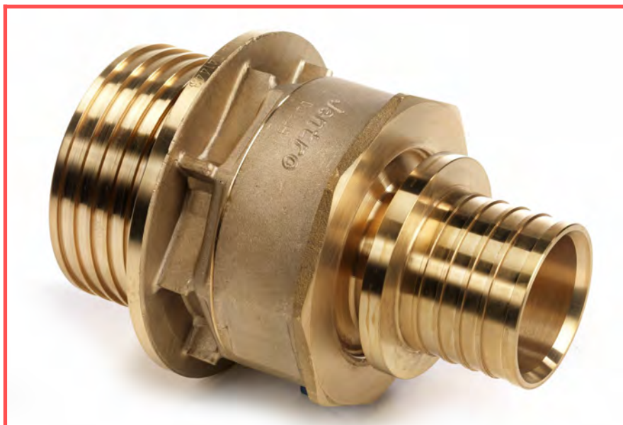
Reductie 125 mm > ...

Ook alle mogelijke reductie T's en reductie koppelingen zijn mogelijk. Vraag ons om de juiste prijs!