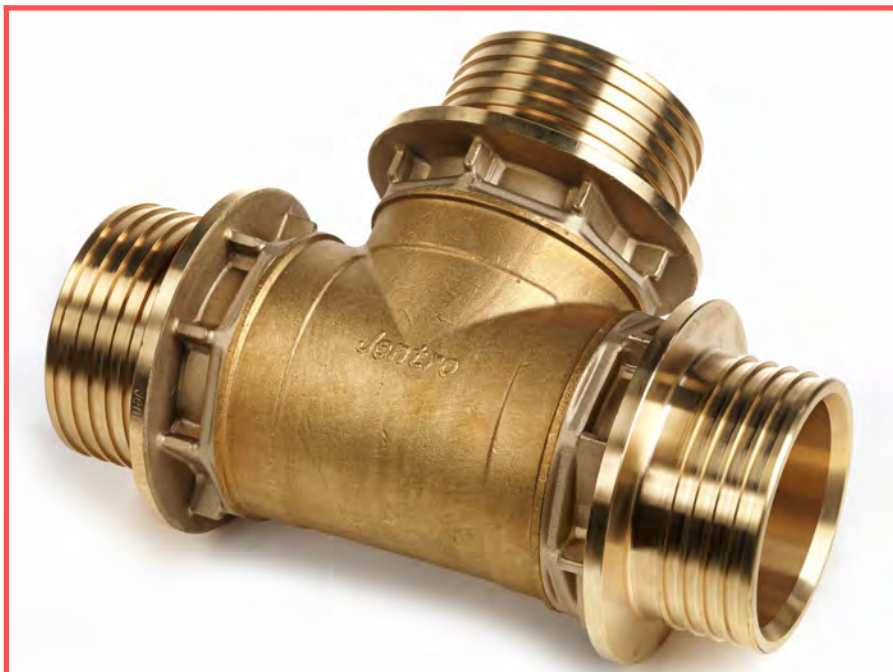
T-stuk 125 mm

Ook alle mogelijke reductie T's en reductie koppelingen zijn mogelijk. Vraag ons om de juiste prijs!